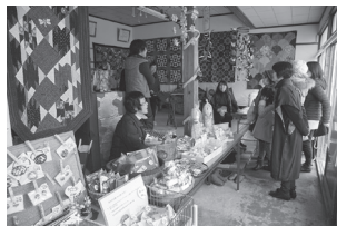
チームかしましのキルト展&雑貨