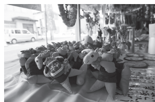
商工会女性部の「獅子追い走」