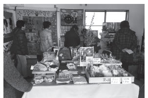
美里蔵/古布の会「展示&販売」