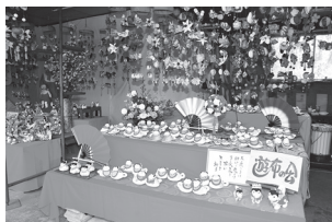
遊布の会「つるしびな展」

高田地域ではひな祭りの時期にあわせて、空店舗を利用した「つるしびな展」や「キルト展」が行われました。さらに商店街にはお雛様や商工会女性部による布細工なども飾られ、道ゆく人の目を楽しませました。自分たちの作った作品を商品として販売したり、訪れる人たちとの会話を通して、今後のものづくり、賑わいづくりに役立つ体験もたくさんあったようです。女性目線ならではの「おもてなしの心」大切にしていきたいですね。