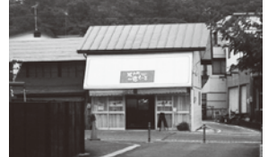
観光駐車場から通りに出て真正面のお店(旧松葉屋さん)