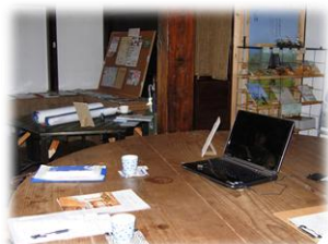
味噌樽を利用したテーブル