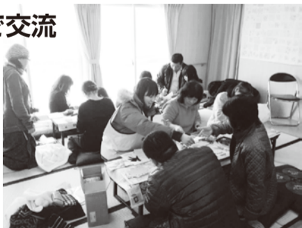
昨年12月25日の「交流会」の様子