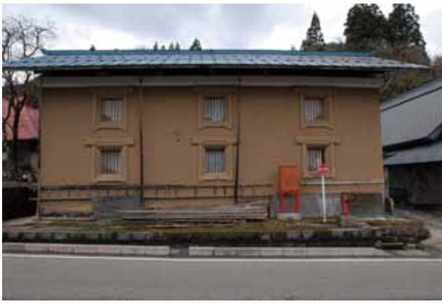
会津美里町関山宿