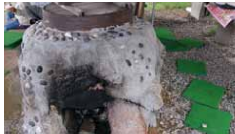
五右衛門風呂 踏み板があれば使える