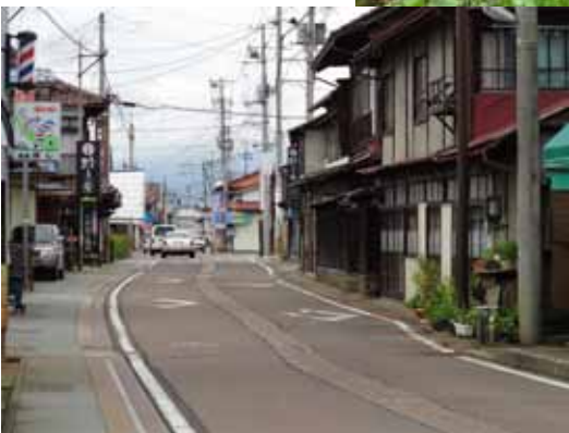
会津本郷焼窯元めぐりができる路地と 雰囲気のある水路