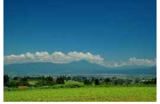
縄文時代の土器等が多数発見されている元兜から磐梯山を望む。