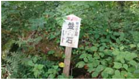
意味不明の参拝所