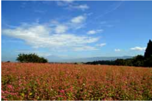
高田地域の西本郵便局近くの赤そば畑