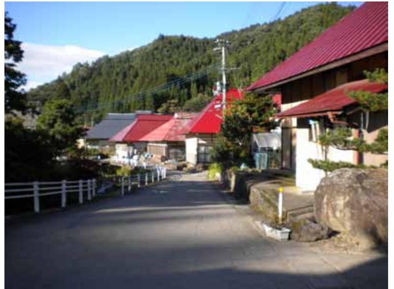
宿場町の面影が残る市野集落。 イザベラバードもこの道を通った。