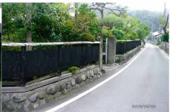
ブロック塀ではなく、土塀や生け垣が景観を良くする。