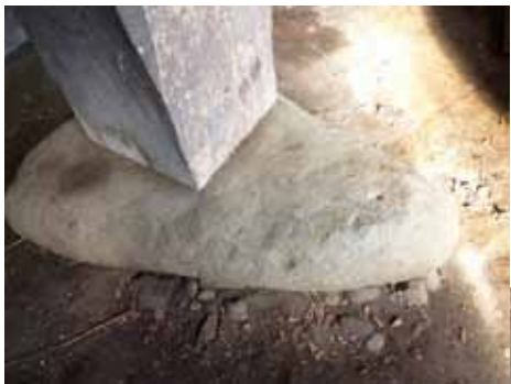
土蔵の柱に使われていた敷石