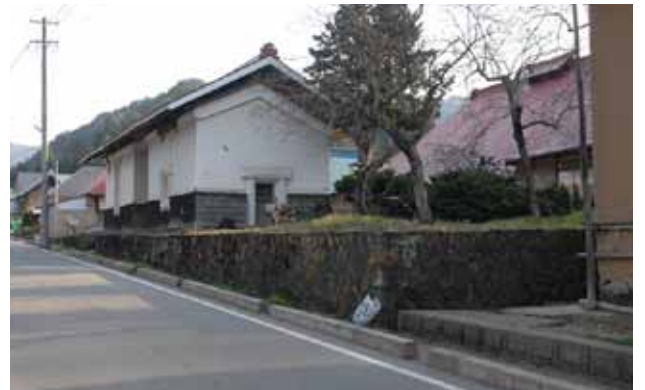
下郷町の大内宿と会津美里町本郷地域を結ぶ県道沿いに位置し、下野街道の要衝として栄えた地域です。